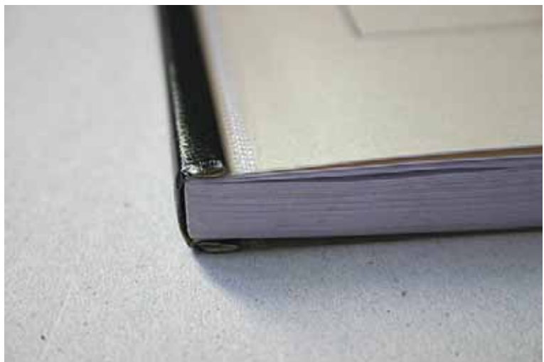
Illustration 2: Gros Plan reliure