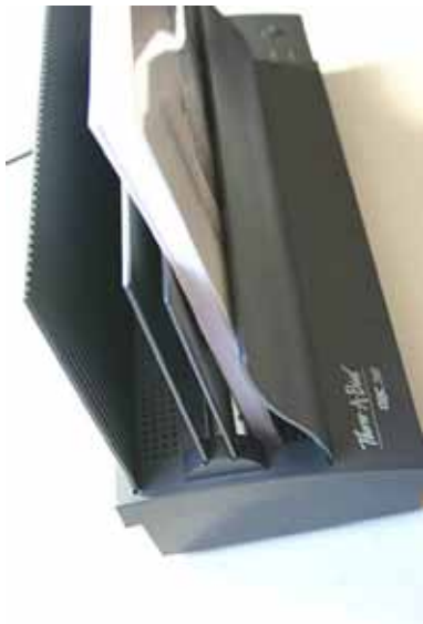
Illustration 1: Thermocollage