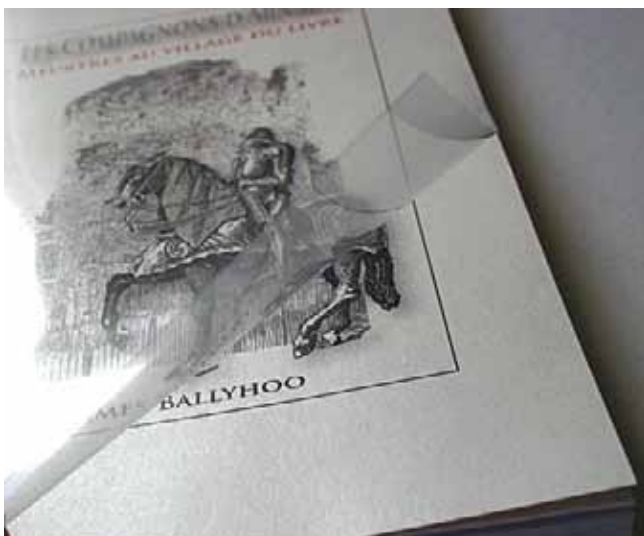
Illustration 4: Protection de la couverture