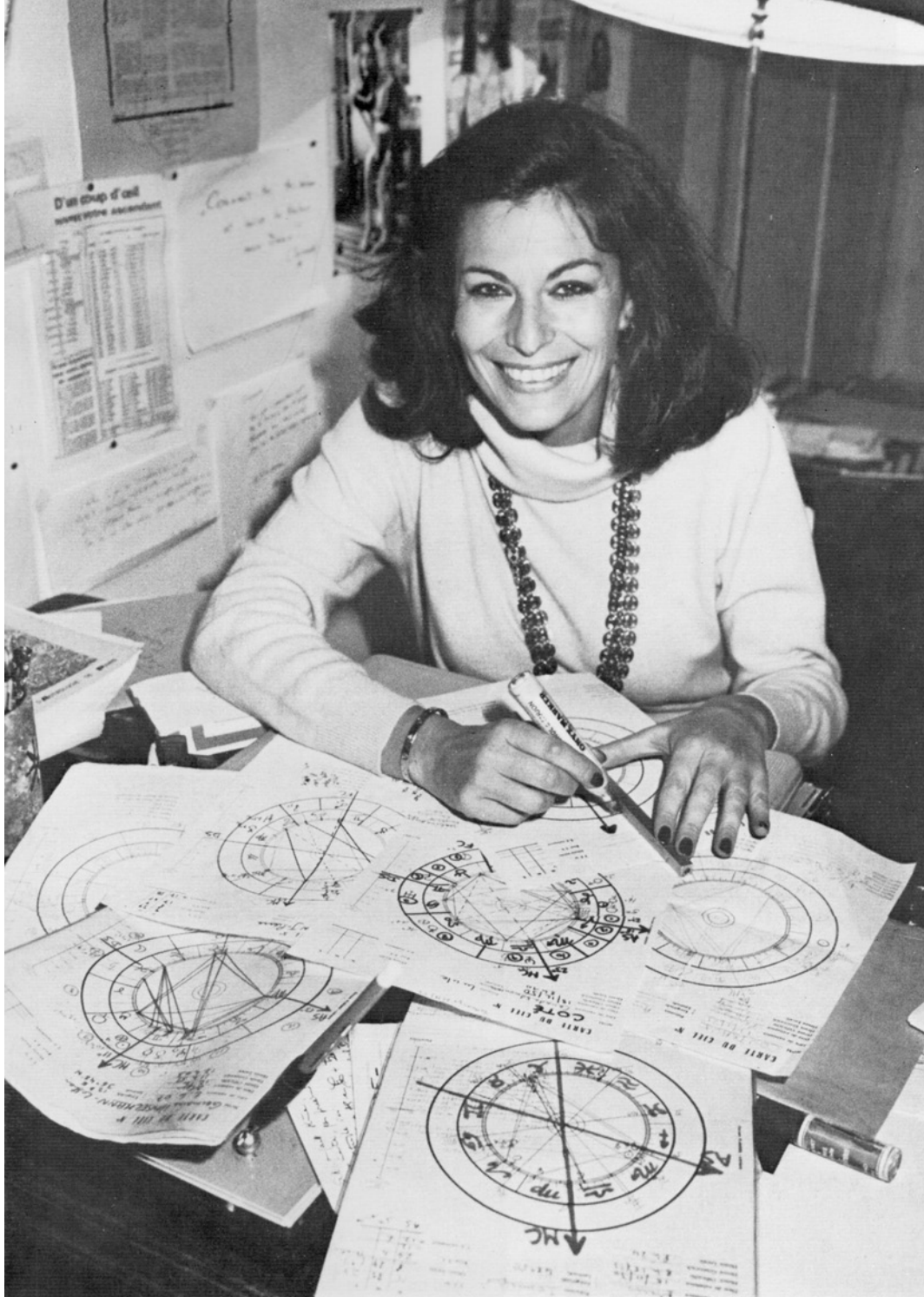
Surprenant sourire devant la perspective de tant de labeur... Mais quand on aime, on ne compte pas !