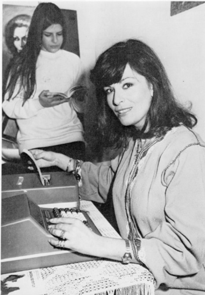
Depuis un an, je me sers d'un ordinateur américain pour mon travail de recherche impliquant des calculs astronomiques (qui seraient sinon inabordables parce que trop absorbants.)