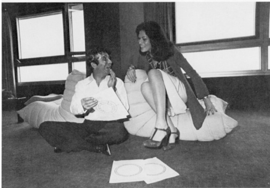
Gilbert Bécaud ? L'inquiétude du Scorpion, la gentillesse du vénusien, la vitalité du marsien. Un entretien chaleureux au dernier étage de la tour du «France», un jour de juin 78.