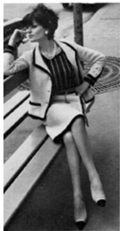
Ma période Chanel.