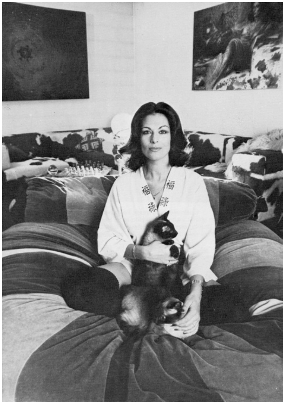
Sur mes chattes siamoises Tiffany et Uranie, j'ai pu également constater la différence qui peut exister entre un Bélier et une Vierge !...