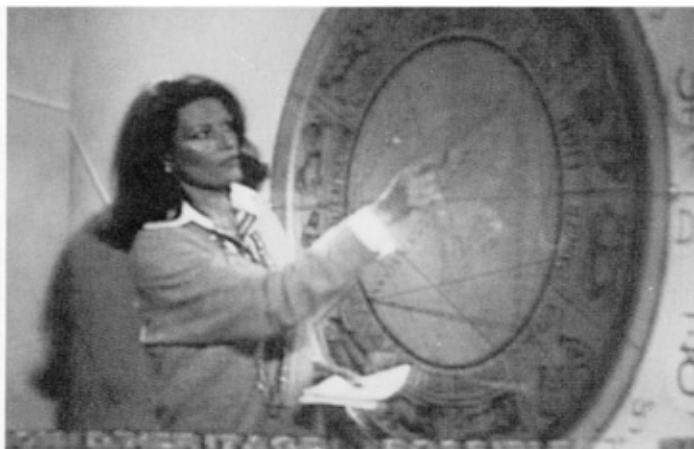
Prise sur le vif, nantie de ma baguette magique, dans « Au bonheur des astres » sur Antenne 2, en pleine démonstration.